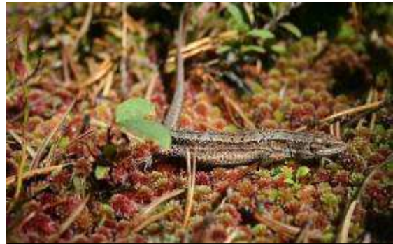
Lézard vivipare dans la tourbière

Outre les animations et visites estivales proposées avec Thibaut Van Rijswijk le technicien garde animateur, une nouveauté 2018 a été l'opération « fréquence grenouilles » le 20 avril 2018, à laquelle 27 participants ont répondu présents pour une présentation en salle et sur le terrain qui a permis d'observer tritons, grenouilles, crapauds et insectes aquatiques.